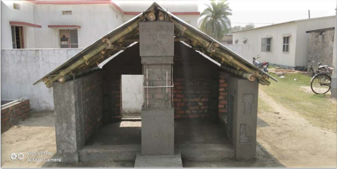
Mason Training on 12-15 February 2019 at Muzaffarpur